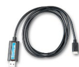
VE.Direct naar USB interface